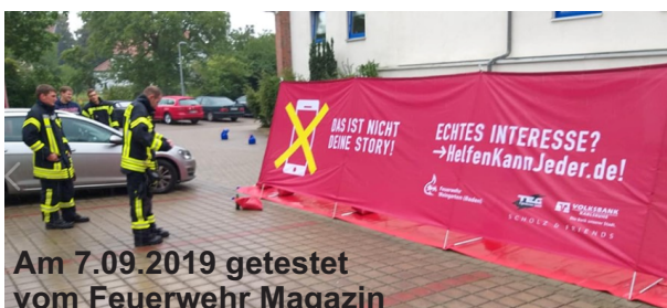
Am 7.09.2019 getestet vom Feuerwehr Magazin